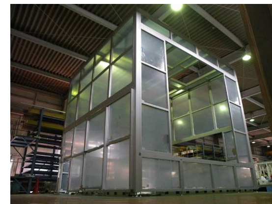
ロボットブース・装置カバー